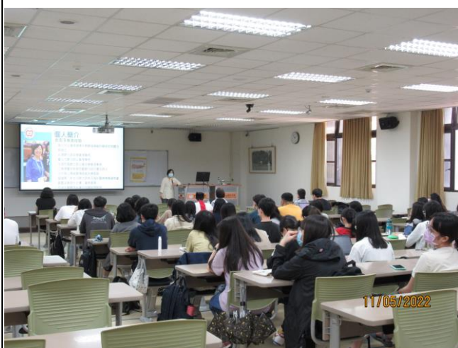
學生專注聆聽講師演講