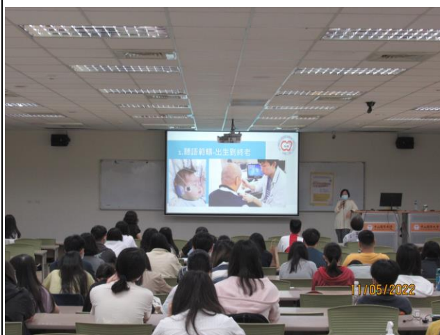
學生聆聽講師演講