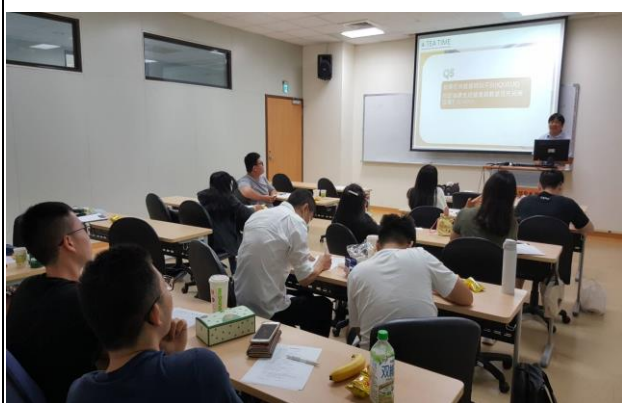
Q & A 時間