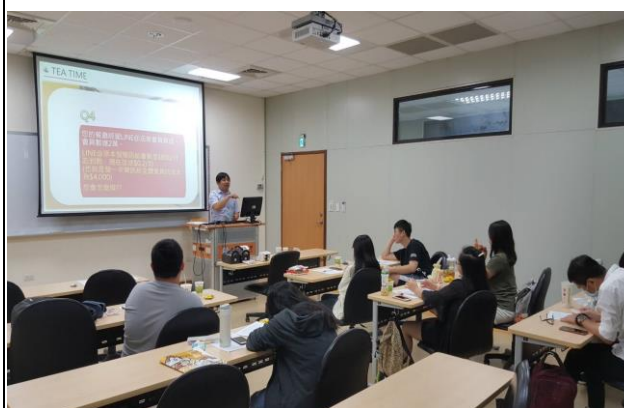
Q & A 時間