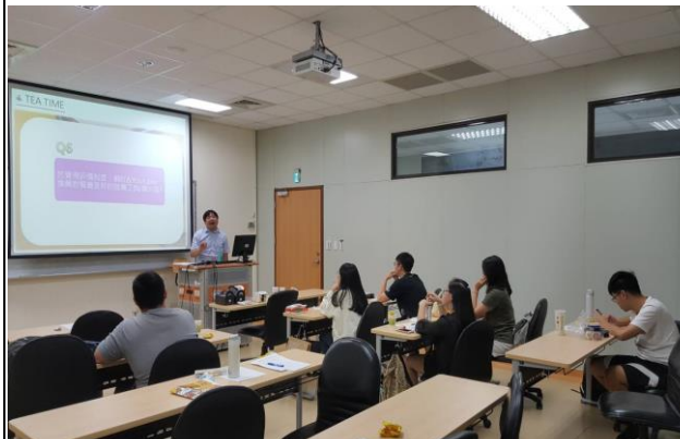
Q & A 時間