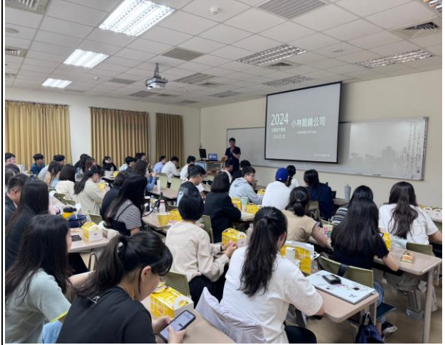
小林鐘錶眼鏡股份有限公司