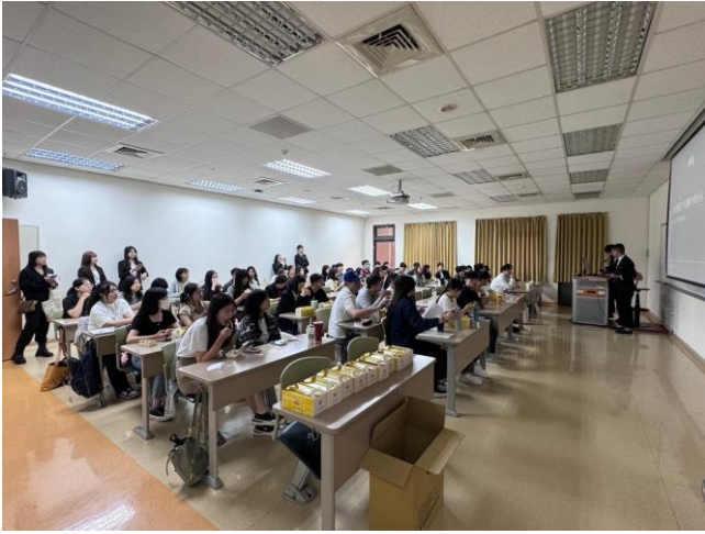
光明分子眼鏡公司