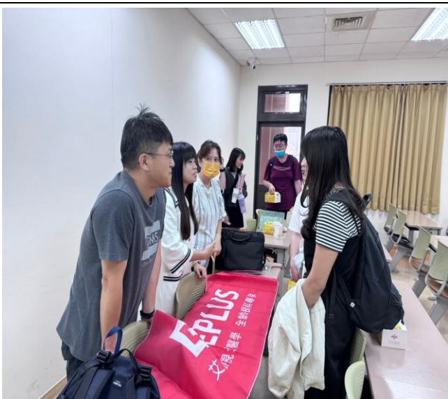
EyePlus 艾佳眼視光醫學集團