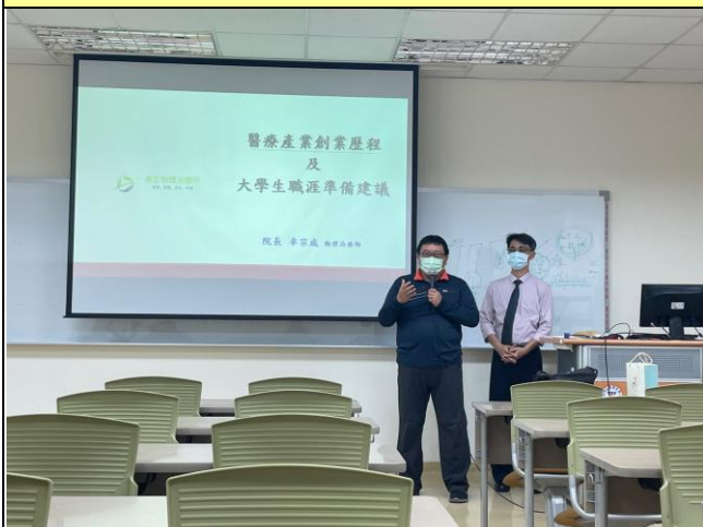
老師介紹演卓宗成講者