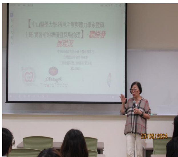
講師介紹語聽職業發展現況