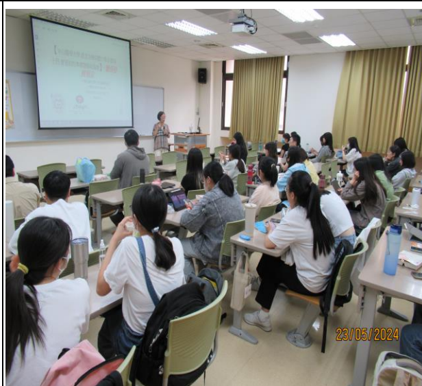
同學們聆聽職輔活動演講