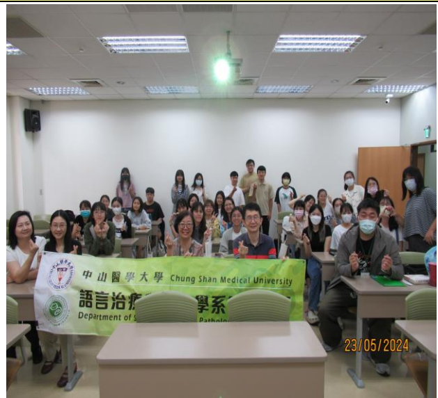
中山醫大語聽系聽力組職輔活動與會合照