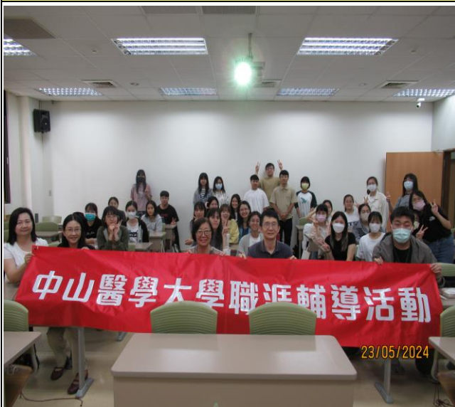
職輔活動與會合照