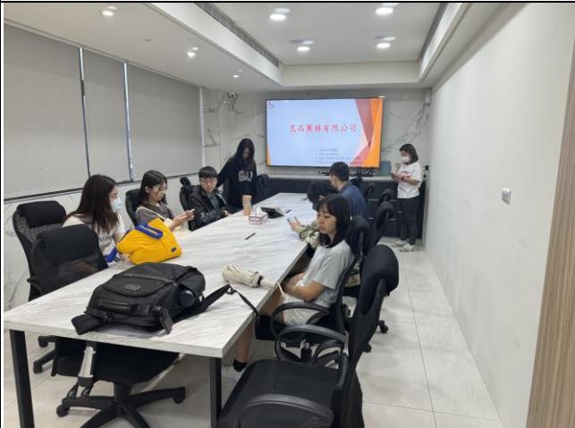
由業務經理說明良品團膳現況，包括公司發展、經營項目、業務合作單位等。