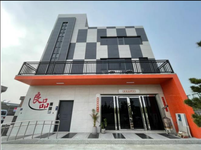
參訪良品團膳--新廠外觀