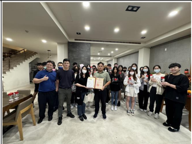
大合影(正中間為良品梁董事長，接受感謝狀)