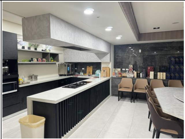
公司規劃之商品製作拍攝宣傳影片區，提供示範教學