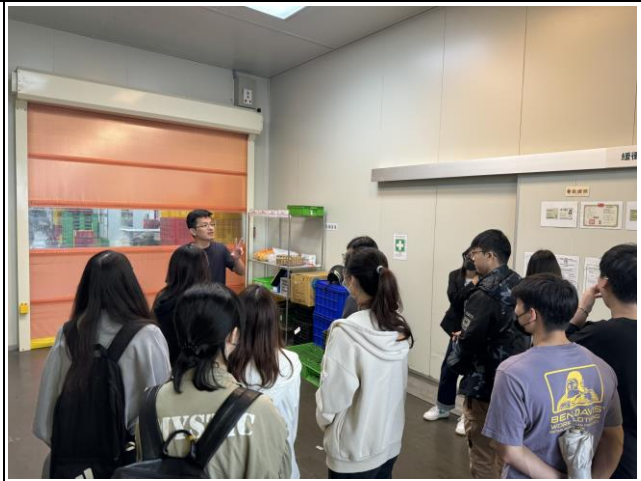
現場廠區內部門口(廠區內部無法進行拍攝)