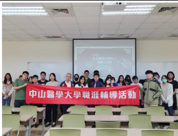
參與職涯輔導活動人員合影