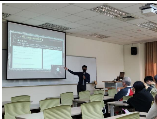
簡介學士-法學碩士學位培育計畫