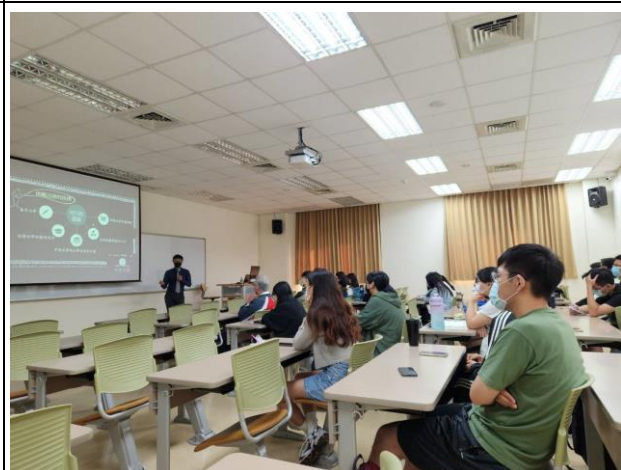
由生醫領域跨領域到法律的多種途徑