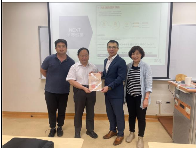
系上老師與講師合照