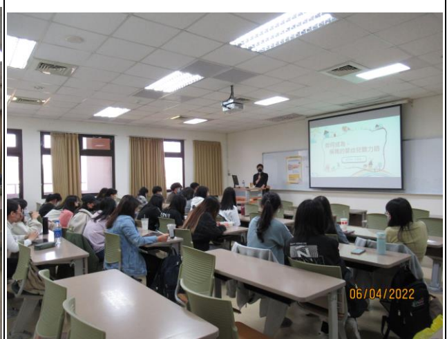
同學認真聽講師分享內容