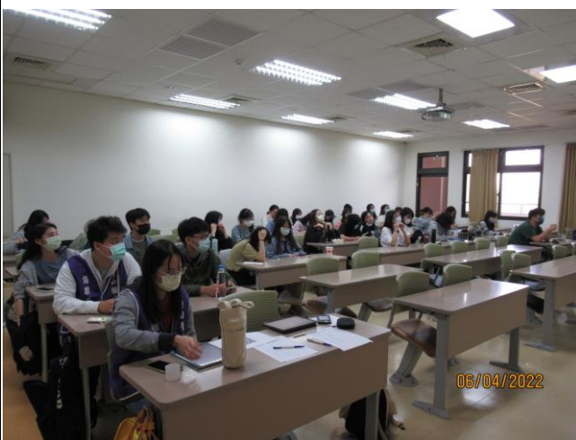
同學認真聽講師分享內容