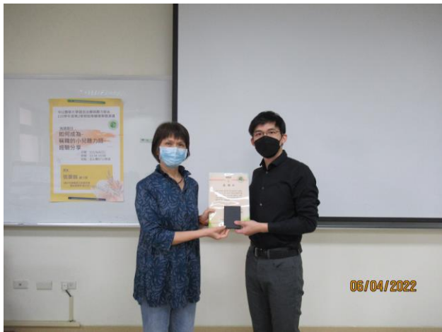
導師頒發感謝狀與紀念品