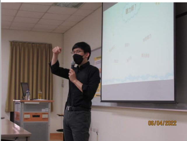
講師認真分享經驗