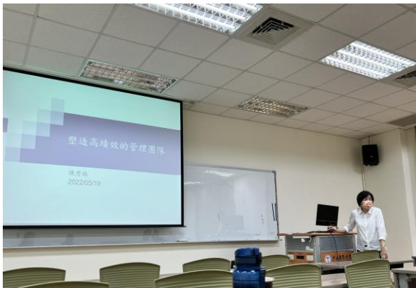
塑造高績效的管理團隊