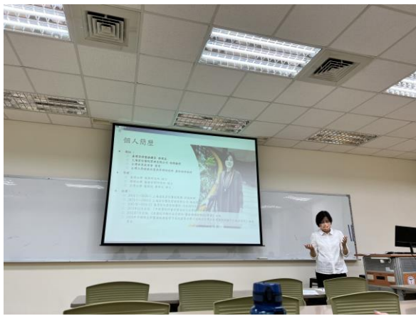
講師個人簡歷介紹