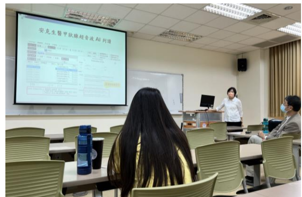
智慧醫療使用案例 1