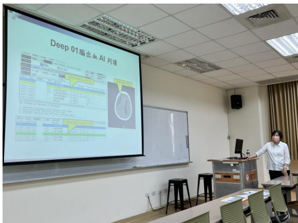
智慧醫療使用案例 2