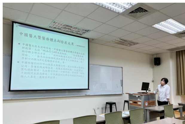
智慧醫療成果介紹