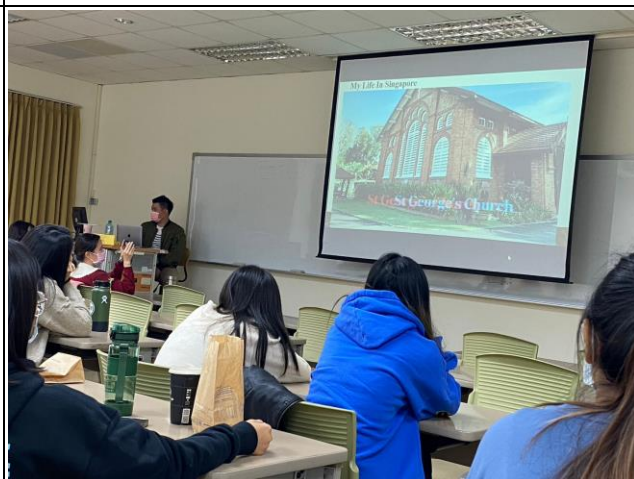
講師分享新加坡生