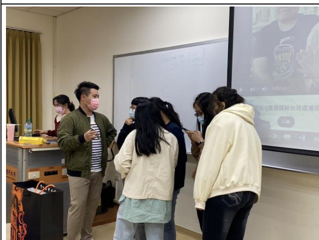
活動後同學請教講師