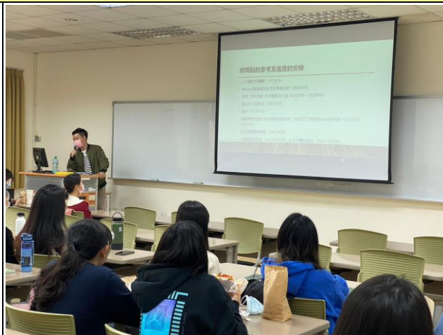
講師說明如何申請新加坡工作