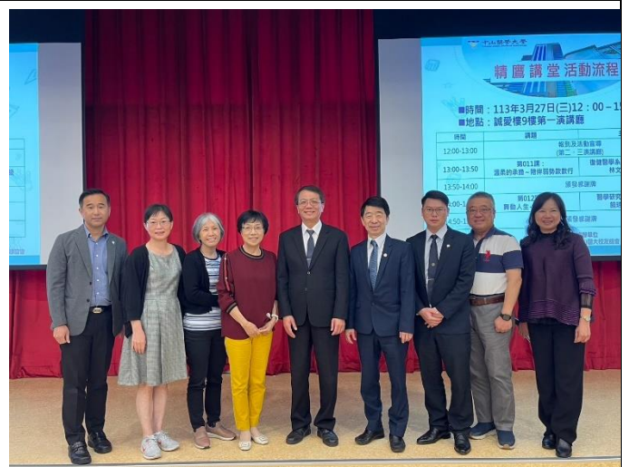
學務長與主講人及參加校友大合照