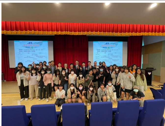
精鷹講堂第 011、012 講 合照留影