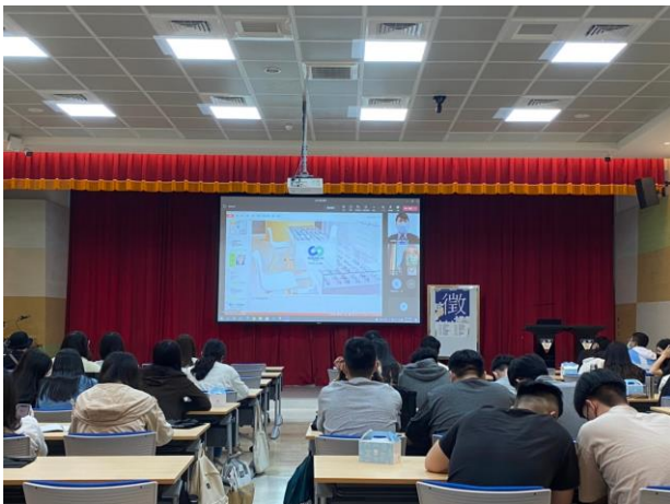
小林眼鏡就業福利介紹