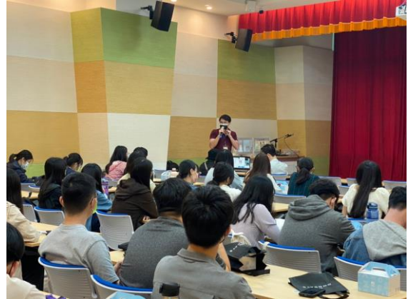
亨泰光學簽約金提問解說