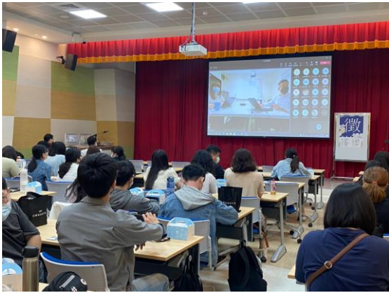
得恩堂眼鏡就業介紹