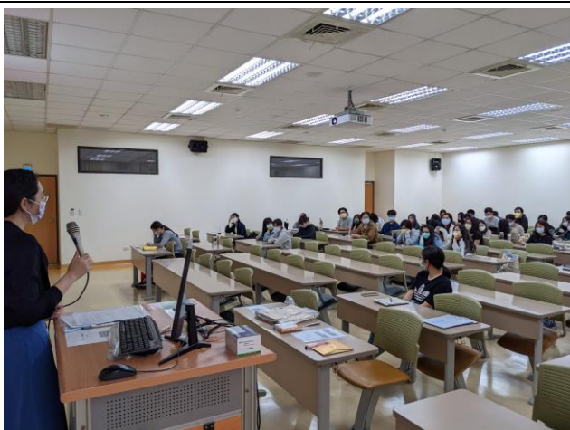
Q & A 時間