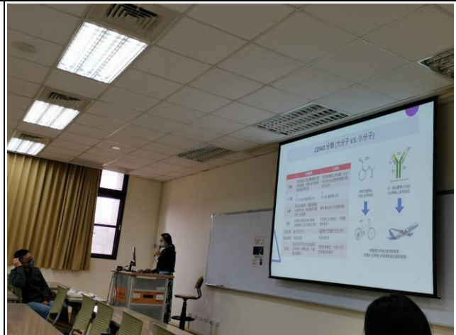
楊宛璇系友經驗分享(3)