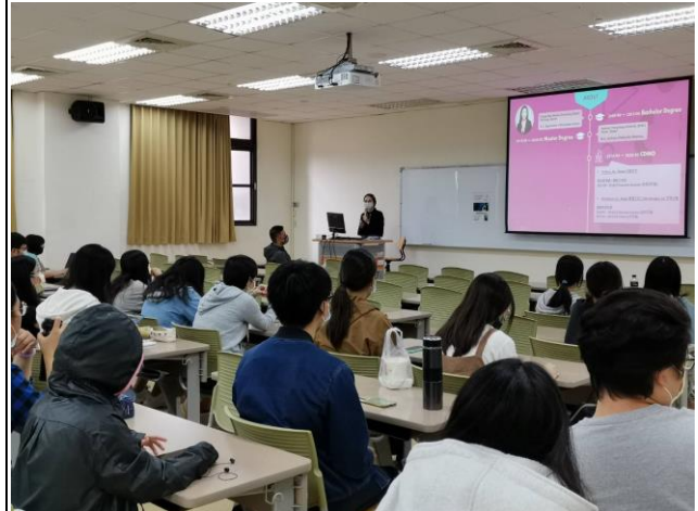
楊宛璇系友經驗分享(1)