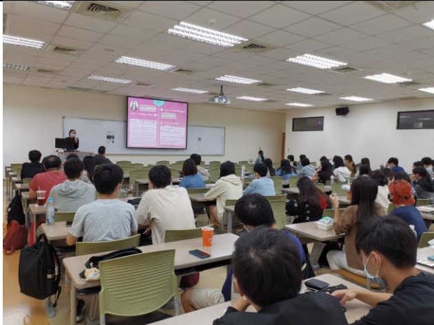
楊宛璇系友經驗分享(2)