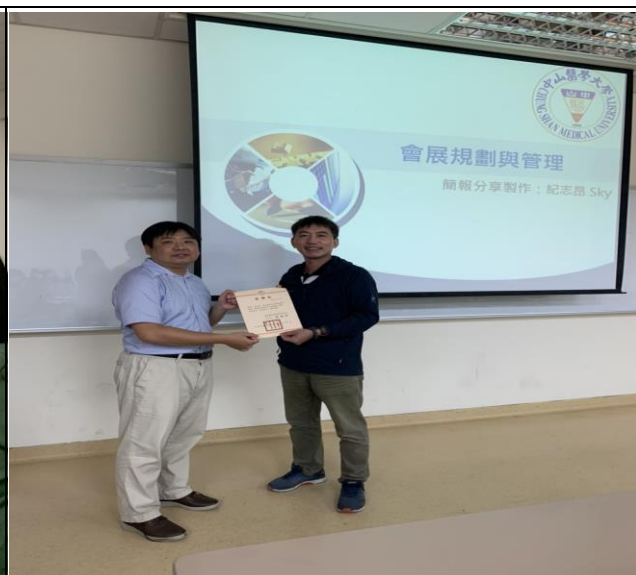
主持人頒發感謝狀