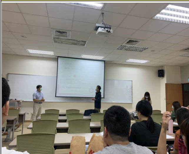
主持人介紹主講者