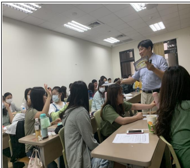
Q & A 時間