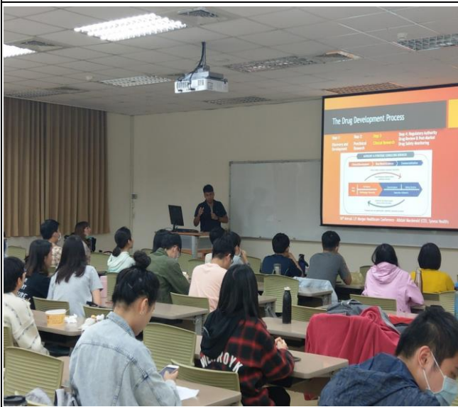
演講者說明臨床試藥工作