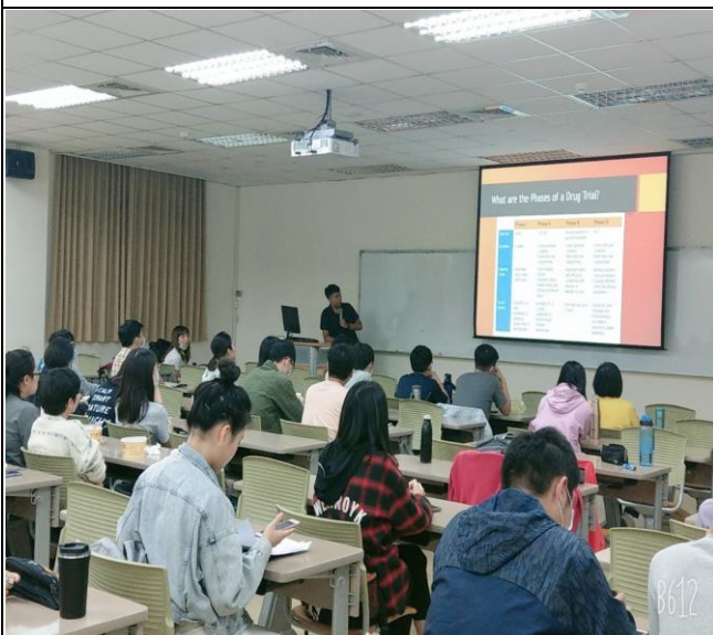
演講者說明臨床試藥