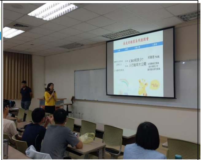
介紹演講者專長及工作領域