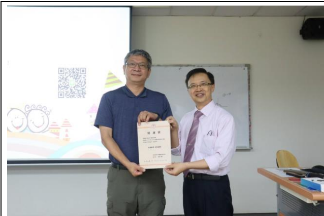
系主任頒發感謝狀