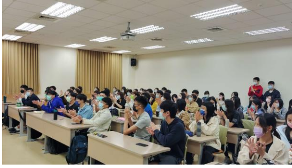
學生感謝杜理事長的分享