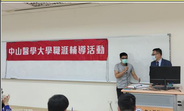
莊濬超老師介紹講者