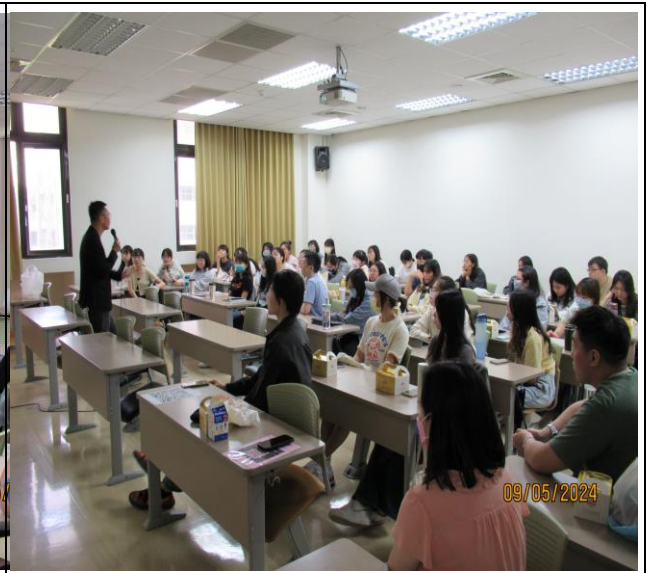
同學專注聆聽職輔活動演講