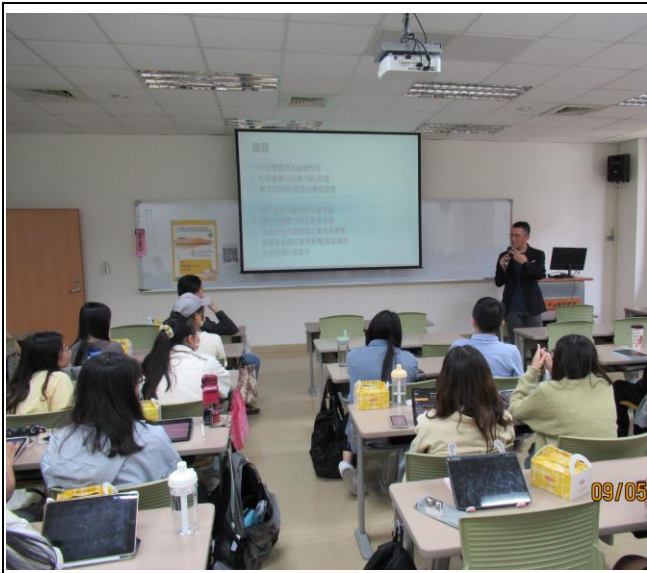
講師學經歷背景介紹