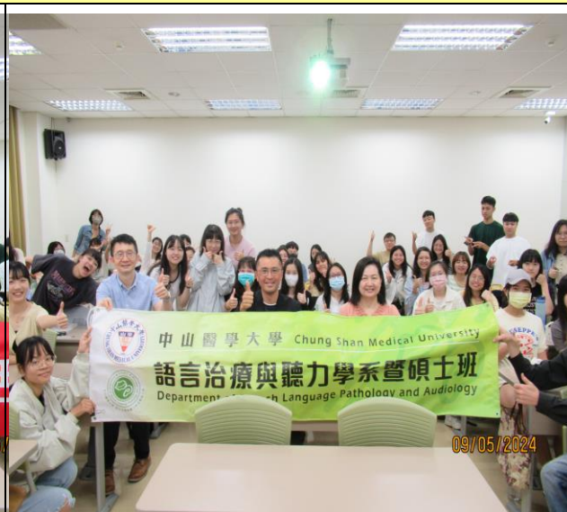
中山醫學大學語聽系聽力組職輔活動與會合照