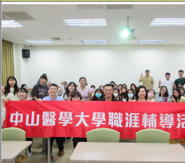
職輔活動與會合照