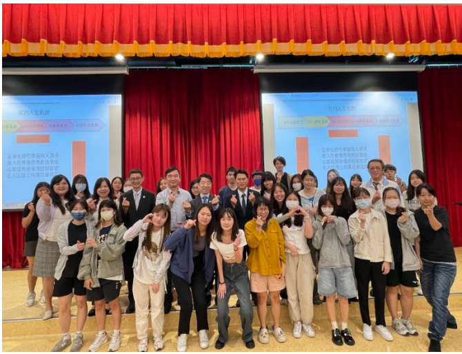
精鷹講堂第 013、014 講 合影