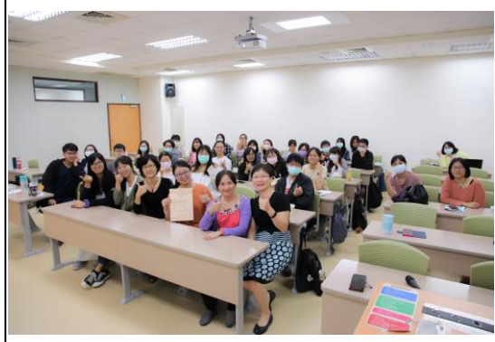
講座結束後的大合照