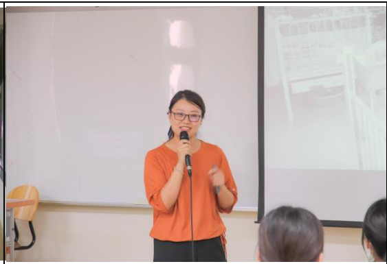
以幽默的方式分享自身的心路歷程