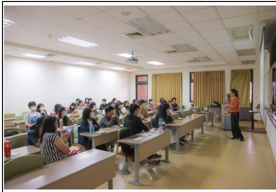
來參與演講的除了學生外，許多護理系的老師們也前來參與這次講座