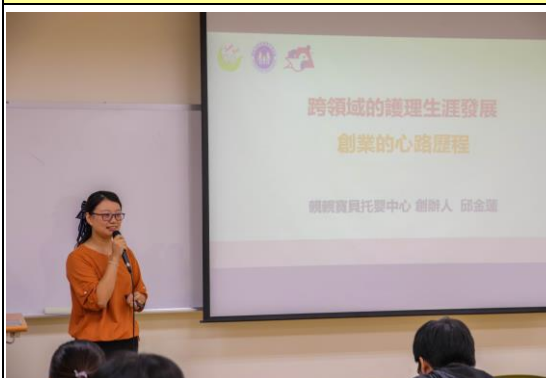
跨領域的護理生涯發展演講