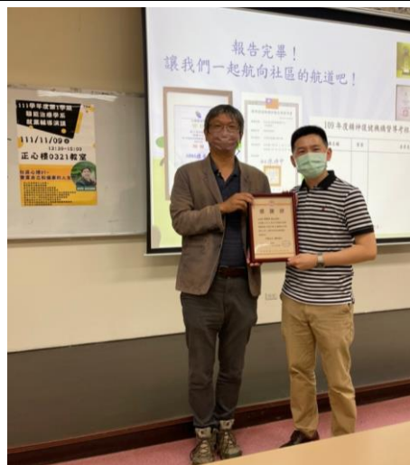
系主任與講師合影並頒發感謝狀