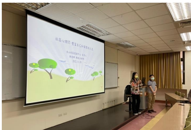
陳韻玲老師引言開場 介紹講師