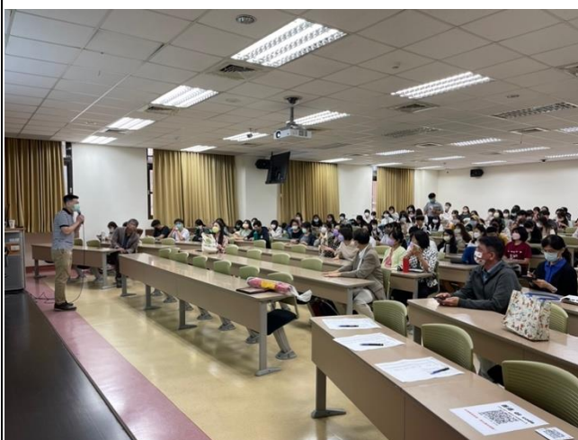
現場同學與老師聽講盛況