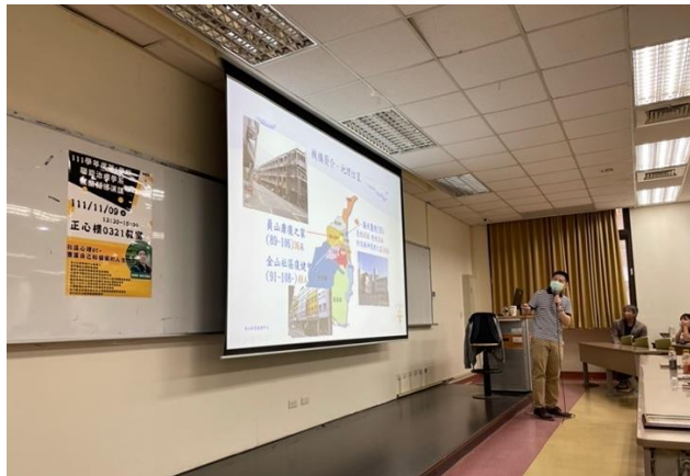
講師介紹執業機構與實務