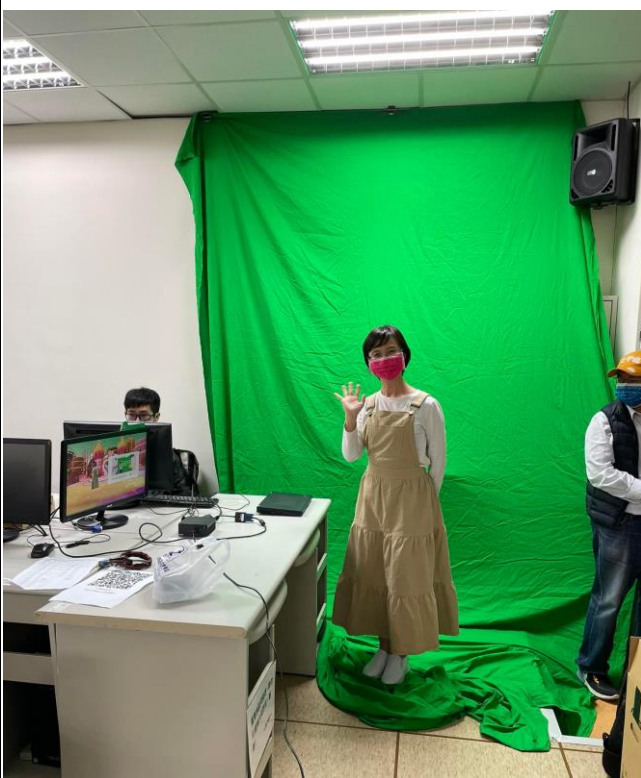
3D 沉浸式直播機展示