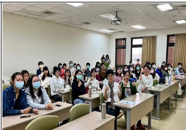
座談會全體師生合影