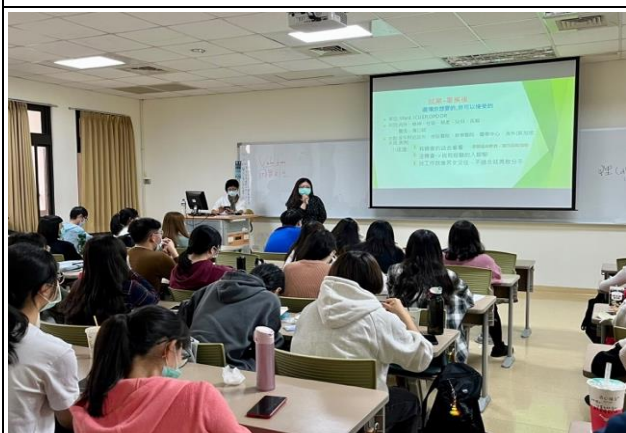
師長給予學弟妹未來就業建議與勉勵