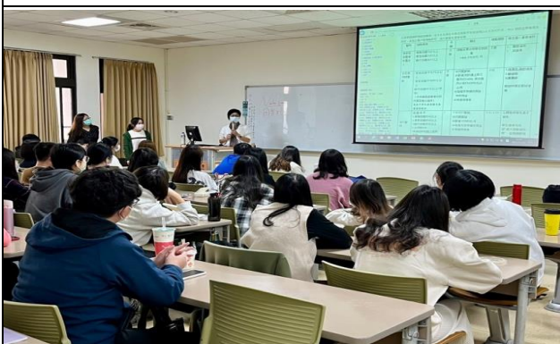
師長以電腦示範操作如何取得相關醫院甄選資訊