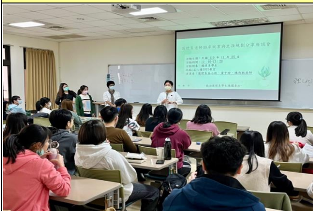
護理系淑杏主任致詞