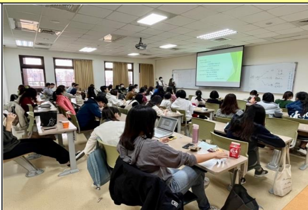
師長分享個人就業規劃經驗