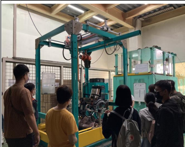
觀看輪椅製作過程