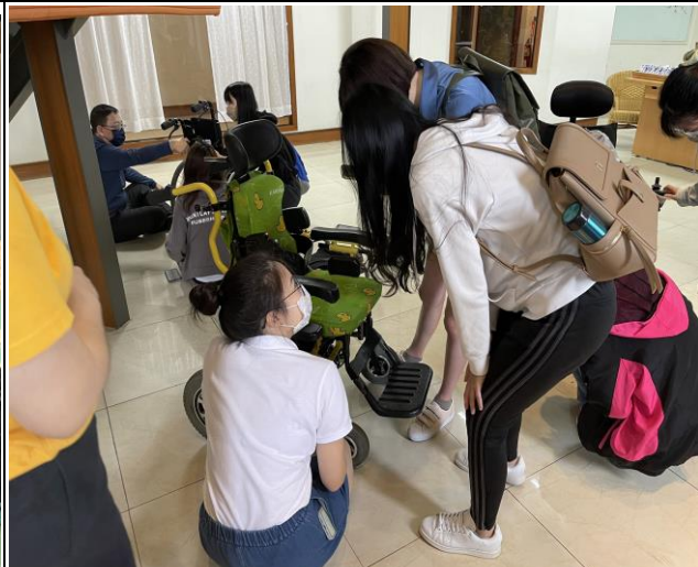
研究不同種類的輪椅