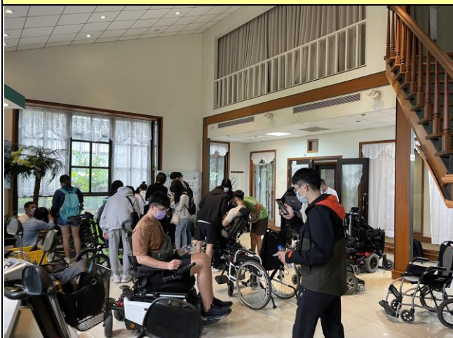
體會輪椅的不同功能