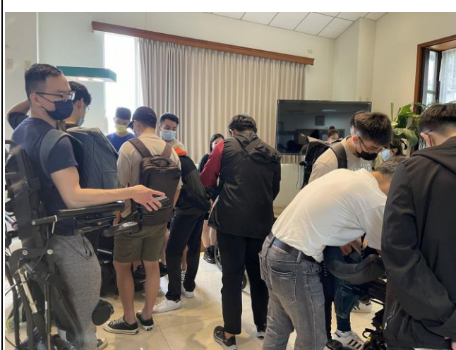
學生實際操作輪椅