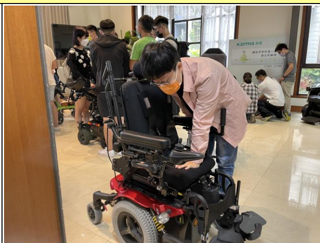
研究不同種類的輪椅