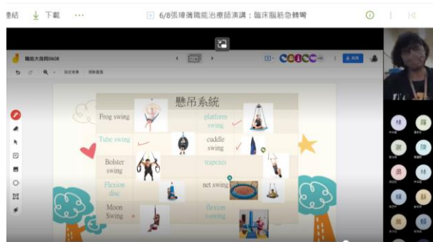
講師與學生線上互動