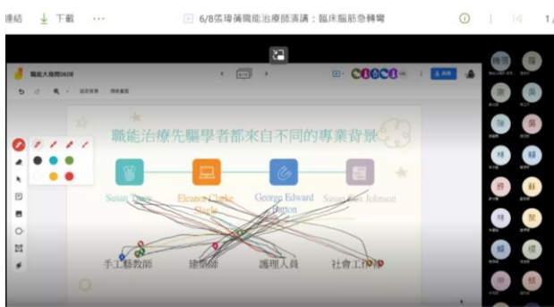
講師與學生線上互動