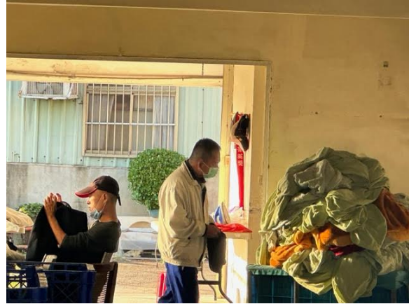
草療的生活：洗衣房夥伴