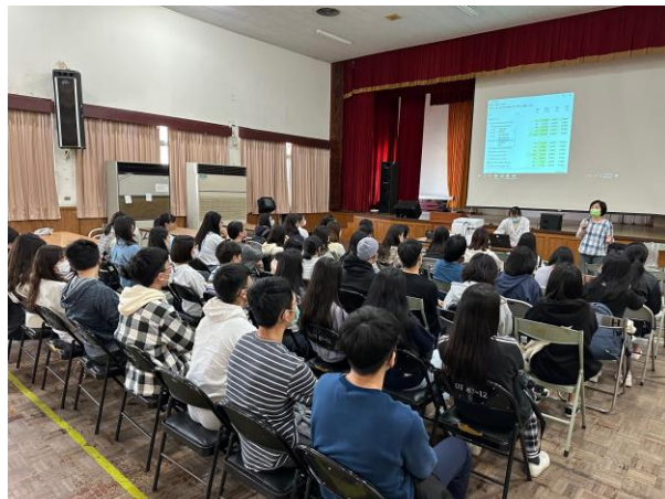
參訪機構說明及介紹