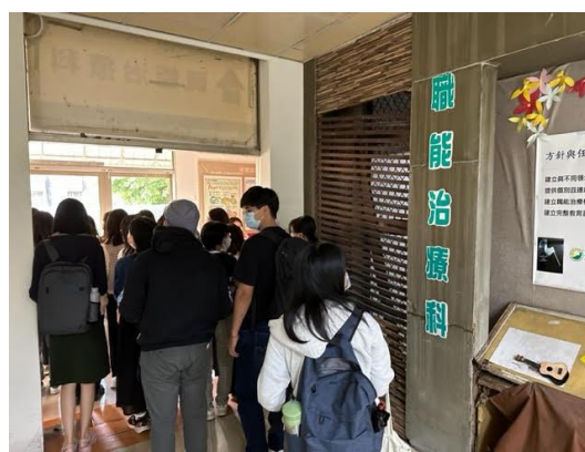
現場參觀：職能治療科一隅