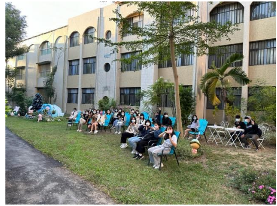
現場參觀：病房中庭園藝