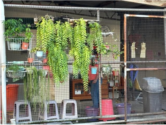
草療的生活：植物與貓