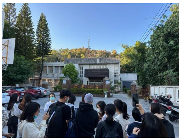
現場參觀：藥毒癮戒護社區