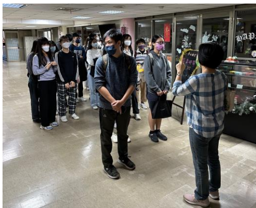
現場參觀：手工產業治療