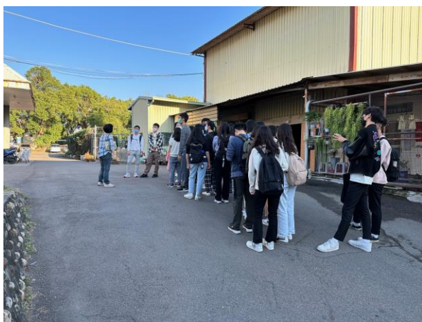
現場參觀：環保工作坊