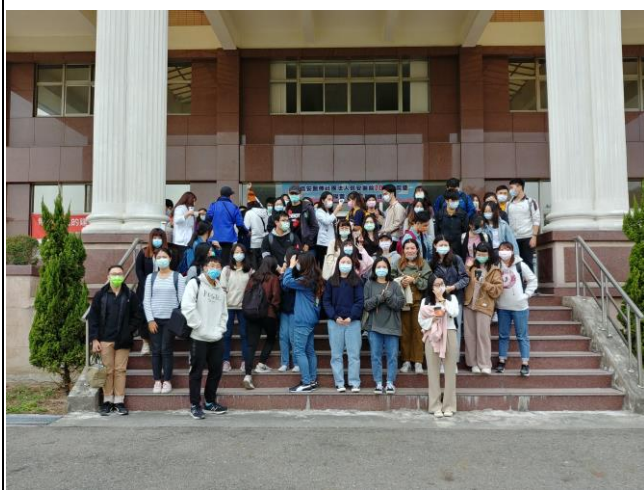
(剛下車，量額溫，做好防疫)