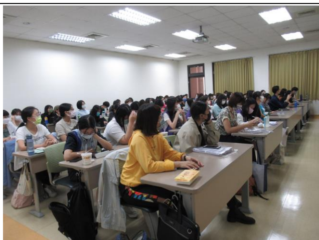
學系同學踴躍參加，教室內座無虛席，參與活動同學專注的視角。