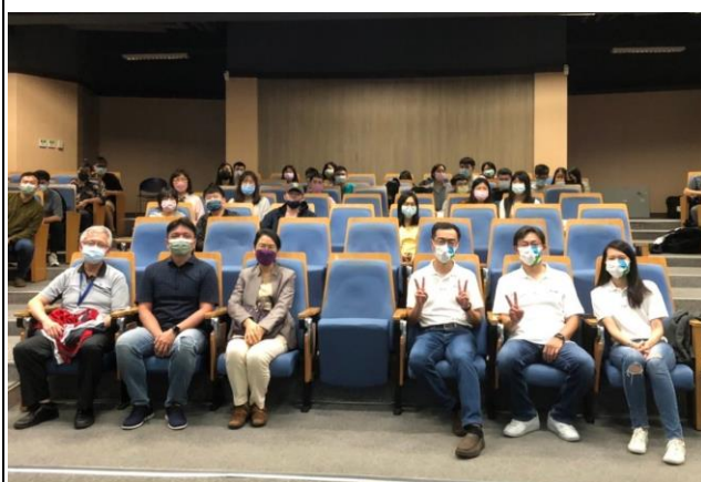
三位講師與本校教師學生合影