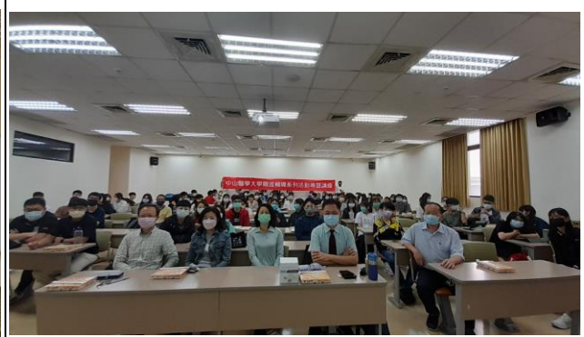
姬兆平系友與全體系友合照