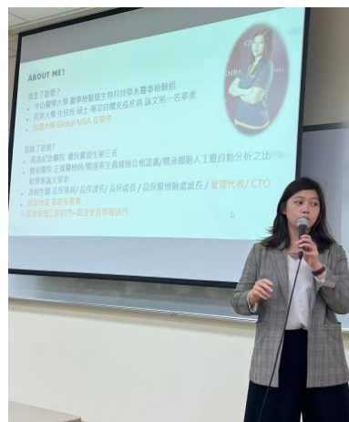
演講者學經歷介紹