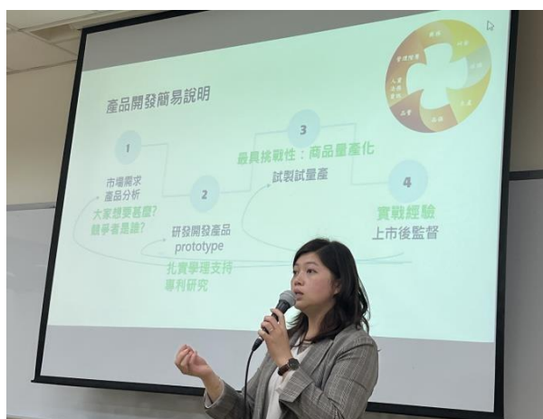
演講者說明產品開發應用