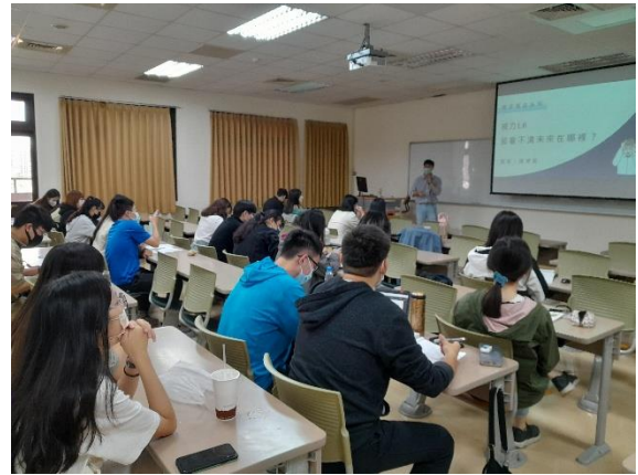
演講主題的由來說明