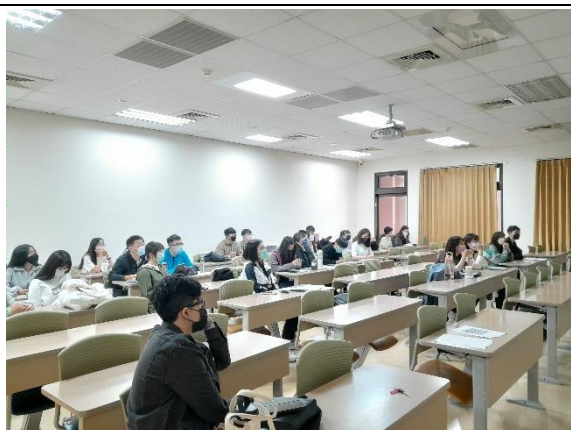
現場同學認真聆聽