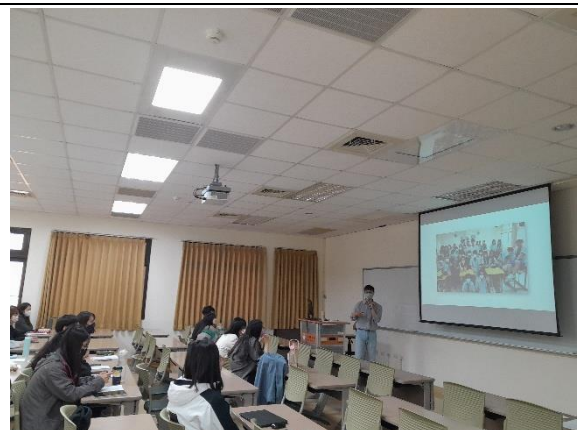
專科教學經驗分享