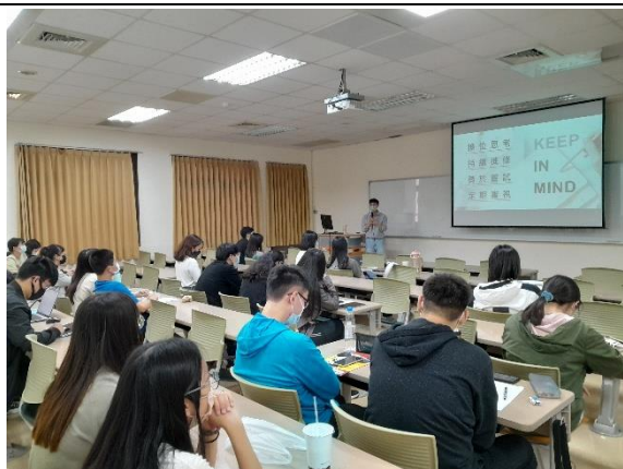
思考/進修/嘗試/審視