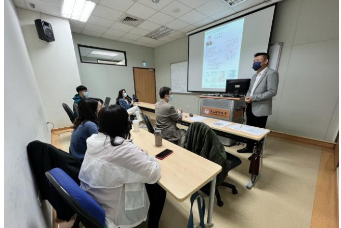
朱建築師經歷介紹