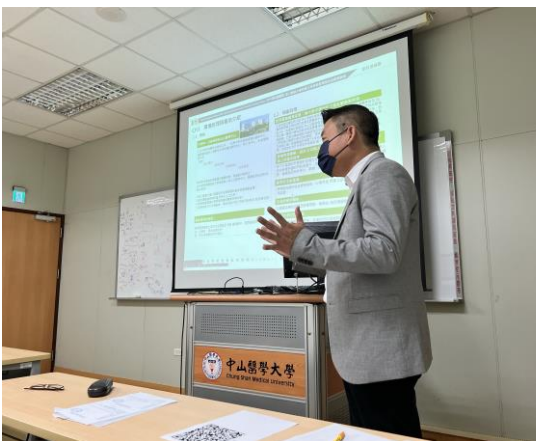
介紹建築事務所之實際案件