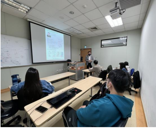
朱建築師經歷介紹