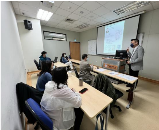
介紹國內外各種醫療建築