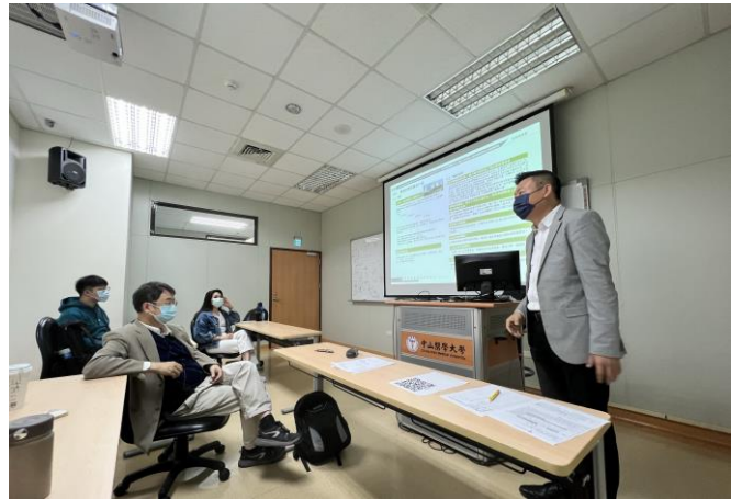
介紹建築常用材質