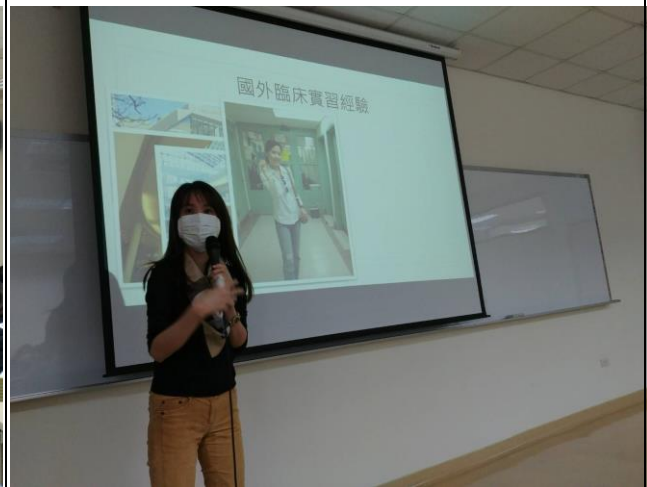
(實習心路歷程的分享)