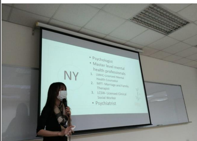
(講師說明紐約州的相關規定)