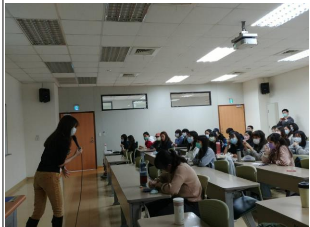
(同學聚精會神地聽講)