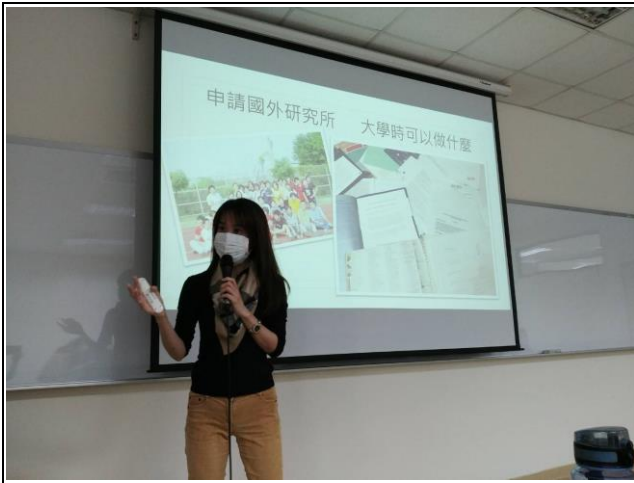
(大學時該有的準備)