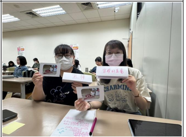
同學針對明信片內容寫下自己的感受