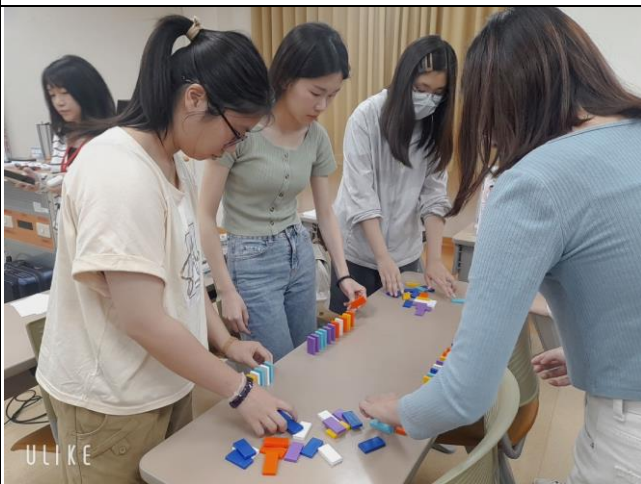
同學分組協力合作完成堆疊骨牌的任務