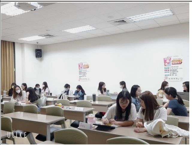
同學分組進行换位思考的活動