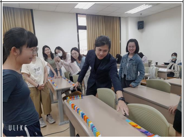
講師驗收骨牌成果，並給予意見