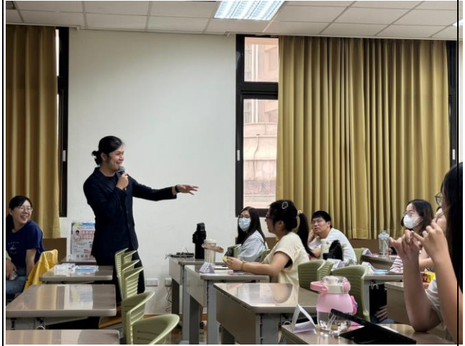
講師與同學進行「溝通」互動