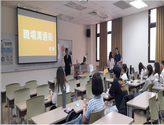
講師介紹演講主題