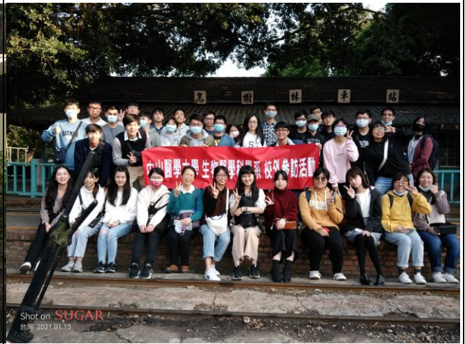
後壁台糖精緻農業事業部參觀後於烏樹林糖廠五分車站前合影