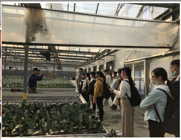
後壁台糖烏樹林糖廠精緻農業事業部蝴蝶蘭培育溫室參觀介紹