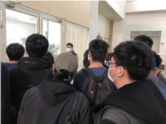
生技廠區內由廠長導覽及簡介相關生產設施及運作