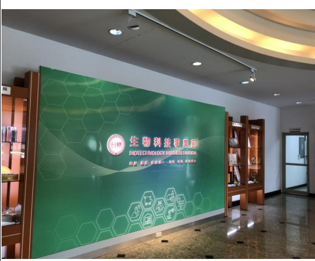
10 點至台糖大林生技事業部會議室觀看簡報影片並聽取簡介