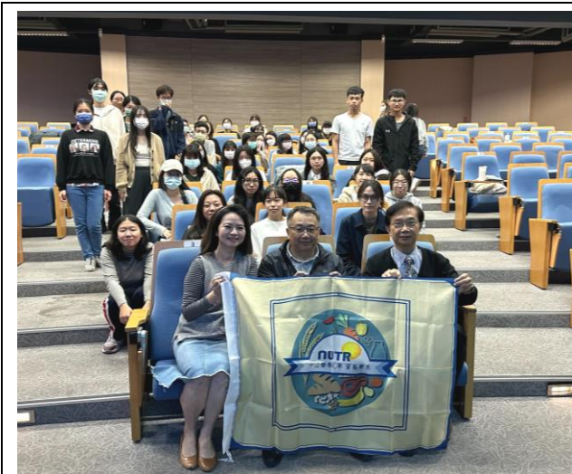
師生合影營養系旗