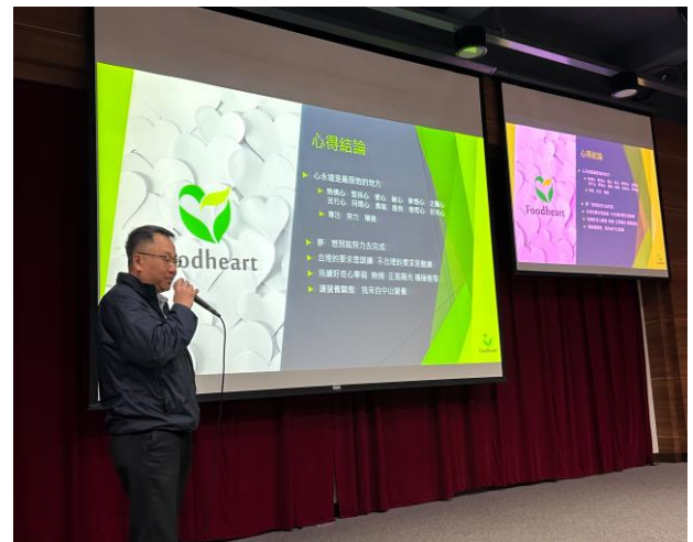
講師分享職涯經驗