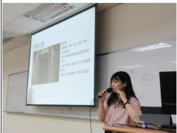
講者介紹學校社會工作師的工作內容