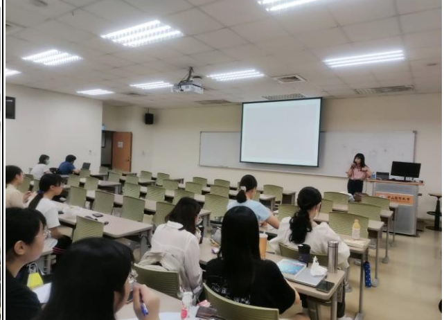
講者說明國小校園文化