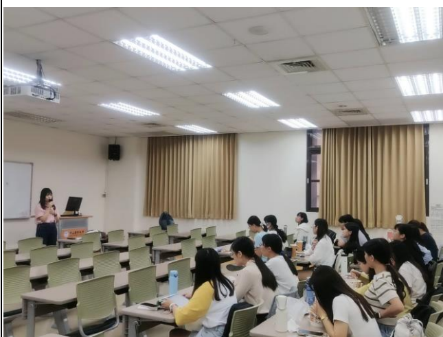
講者說明學校社會工作常遇到的校園問題