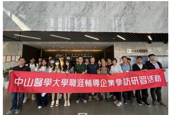
參訪師生於傳統產業創新加值中心前合影