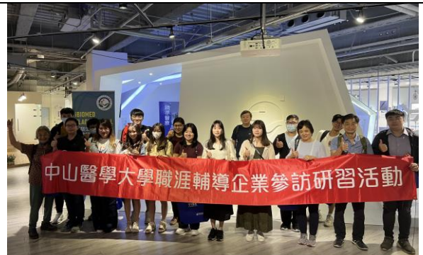
參訪師生於智慧生醫旗艦館前合影