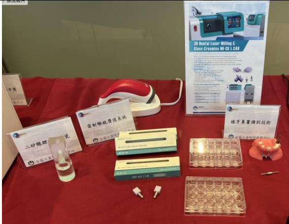
展示主題包含二矽酸鋰玻璃陶瓷、植牙鼻竇鑽削技術與雷射雕銑贖復系統