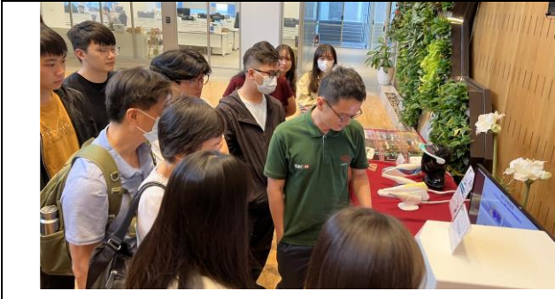
牙模桌掃系統的介紹