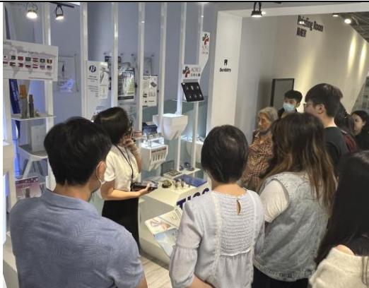
皇亮生醫科技股份有限公司人員進行產品介紹