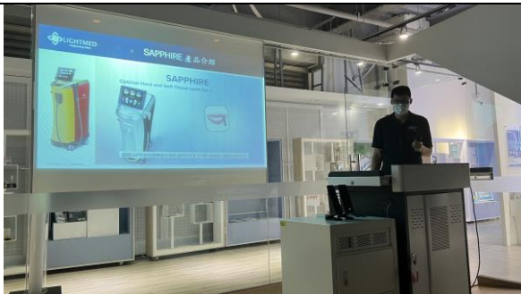
鐳鼎科技股份有限公司工程師 對水雷射應用於牙科手術進行簡報