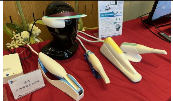
歷代口內掃描系統技術