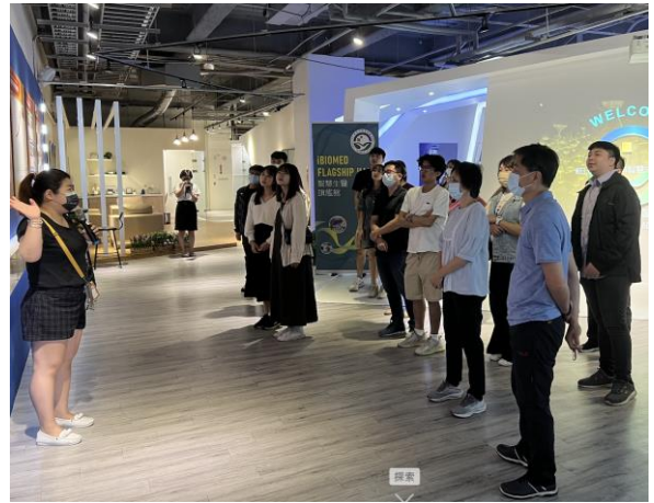
智慧生醫旗艦館展示導覽