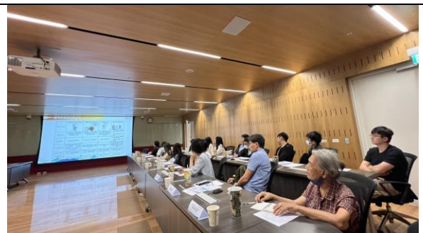
參訪師生聆聽簡報