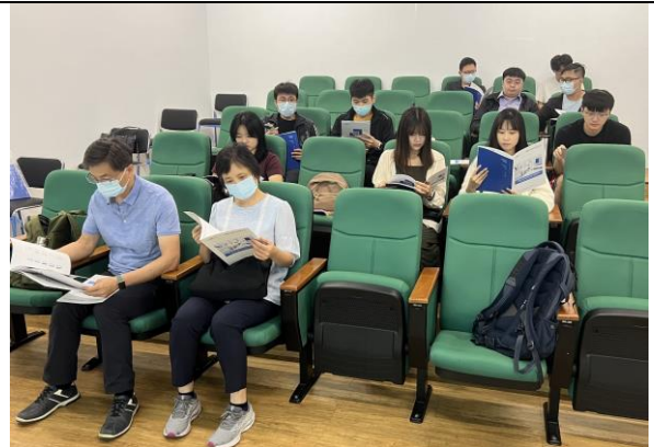
參訪師生聽取廠商簡報