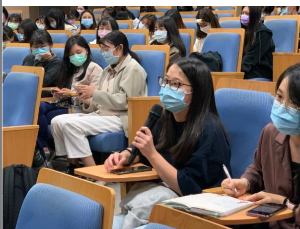
同學對於菜單設計概念進行提問