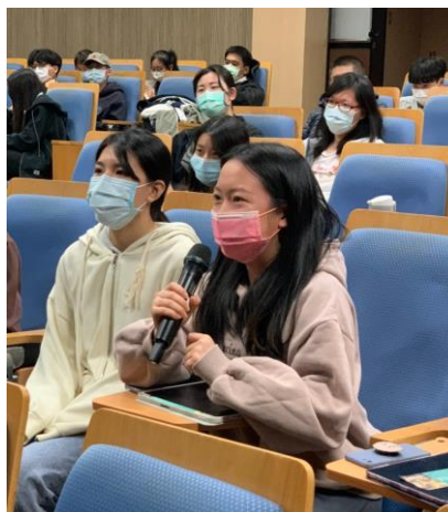
同學針對人員如何有效管理進行提問