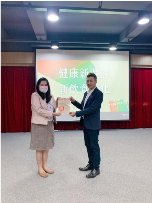
黃詩茜老師致贈感謝狀