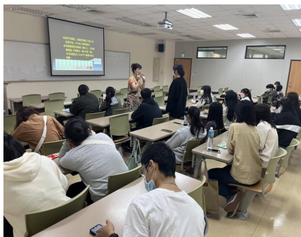
形象塑造-護理師上班適合裝扮