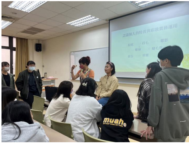
講者彩妝實際運用 1