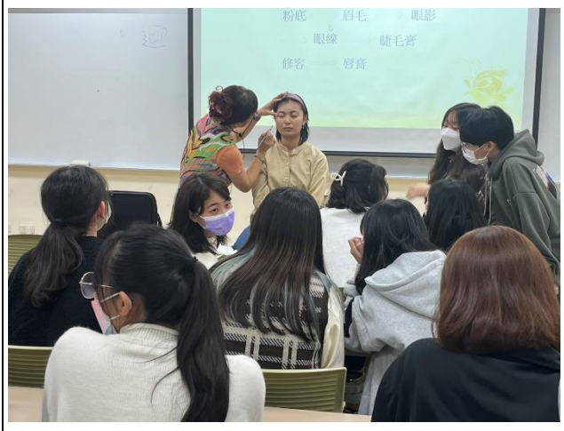
講者彩妝實際運用 2