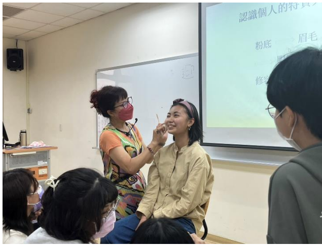
講者彩妝實際運用 3