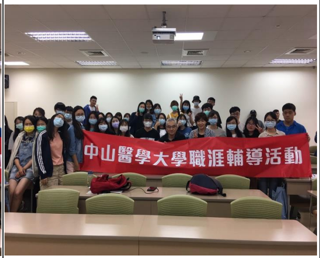
(演講活動後大合照_正心樓 0816)