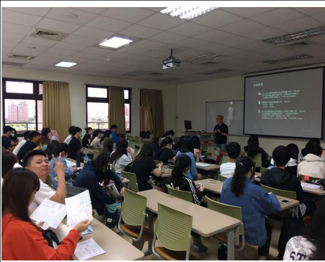
(演講活動照片_正心樓 0816)