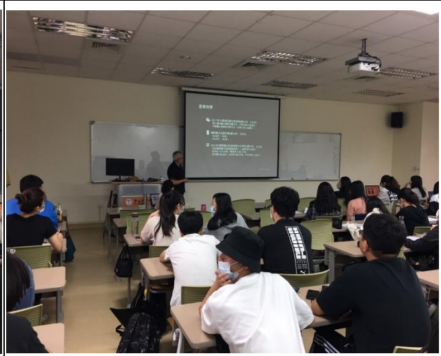
(演講活動照片_正心樓 0816)