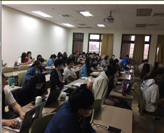
(演講活動照片_正心樓 0816)