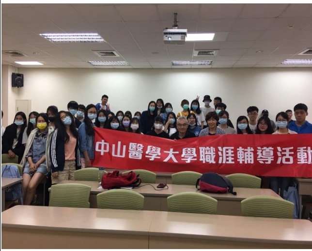
(演講活動後大合照_正心樓 0816)