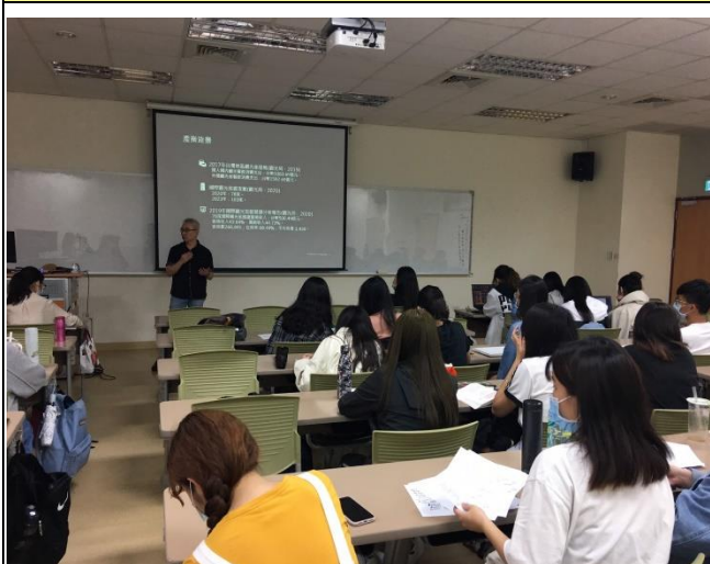
(演講活動照片_正心樓 0816)