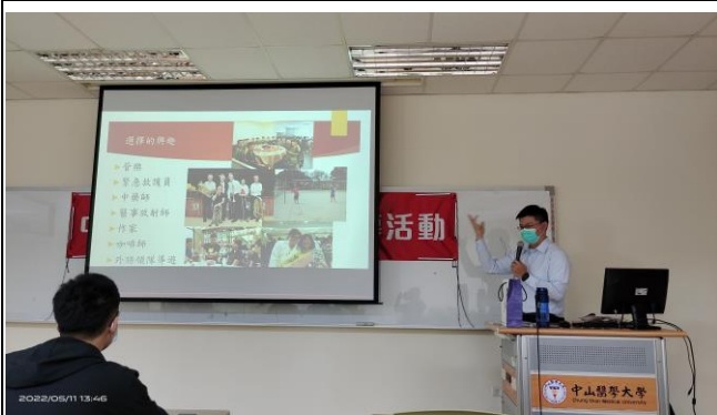
陳校友介紹人生的各種角色