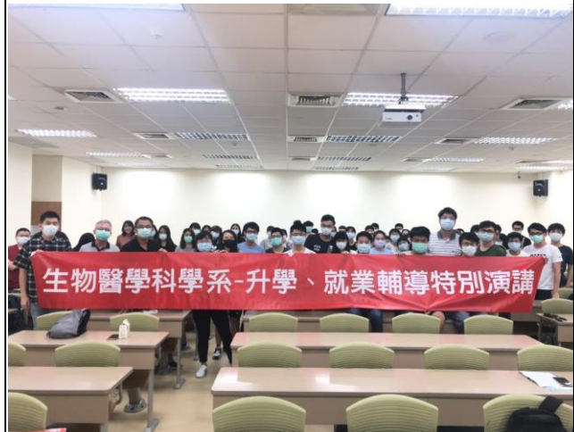
活動舉辦圓滿成功