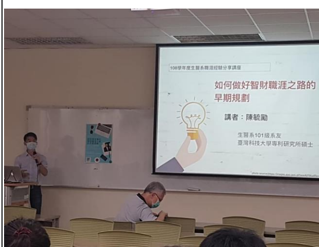
系友演講:智財規劃