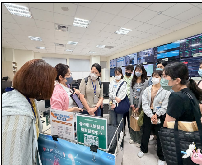
(參觀遠距醫療中心)