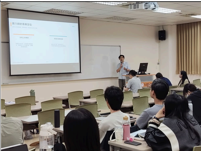
講者介紹基金會性質與工作型態