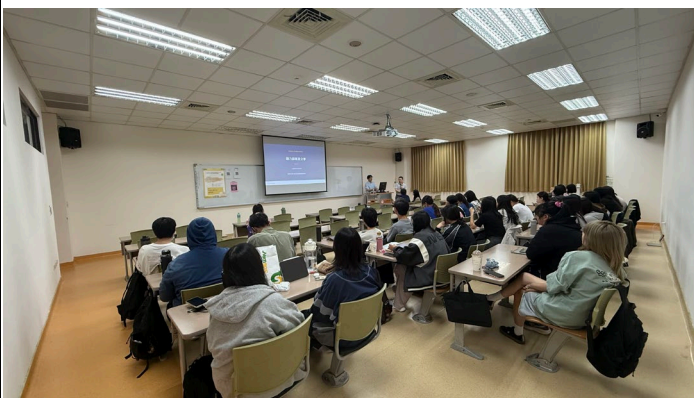
主持人開場介紹講者