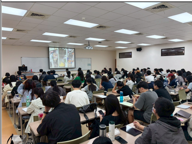
現場同學專心聽講