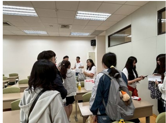
學生與廠商現場面試互動