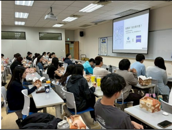
廠商介紹企業文化