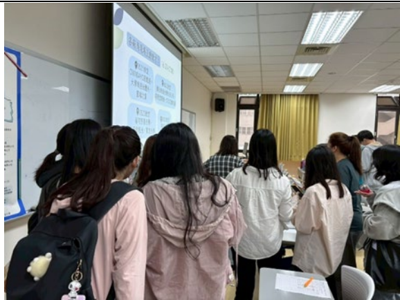
學生與廠商現場面試互動