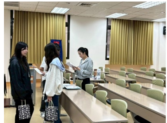
學生與廠商現場面試互動