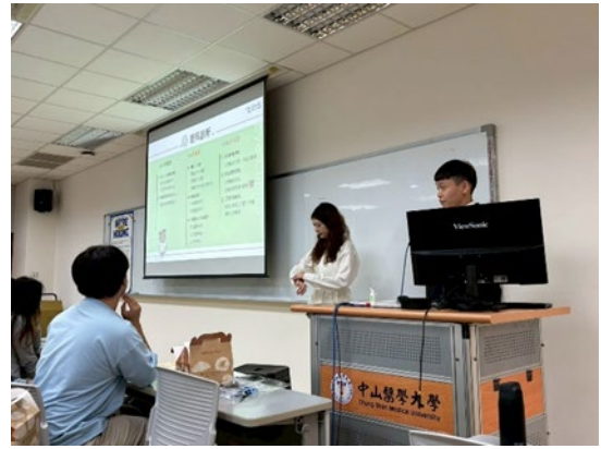
諾貝爾眼科介紹薪資福利