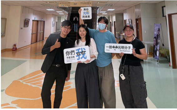
學生進行面試互動環節