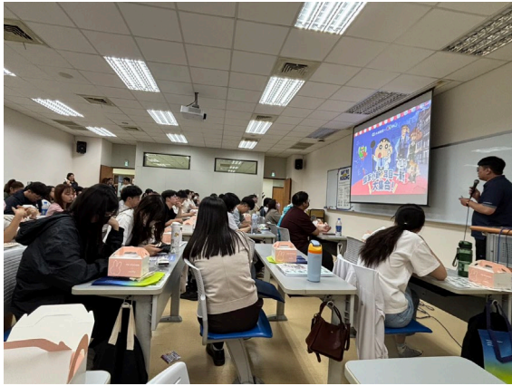
小林眼鏡介紹企業文化與薪資結構