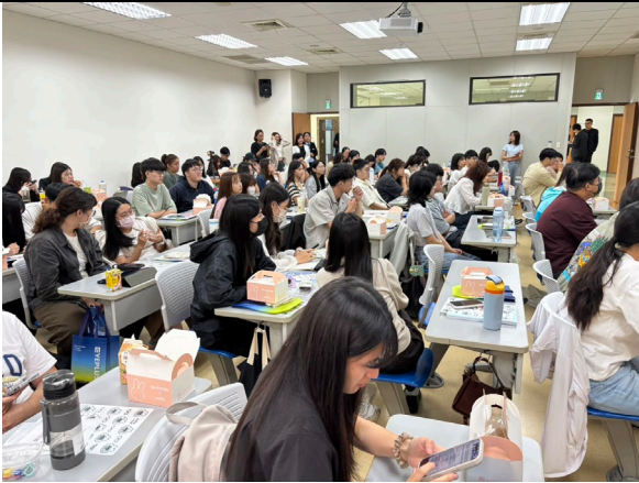
學生認真聽各廠商簡介