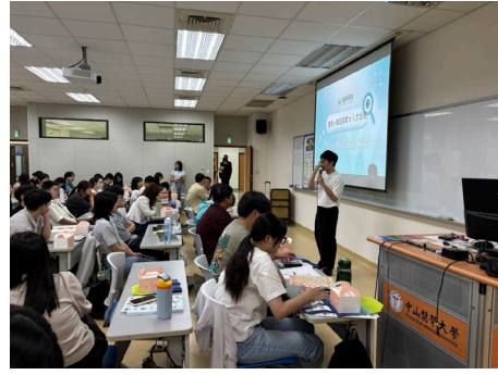
濼視眼科介紹企業文化與薪資結構