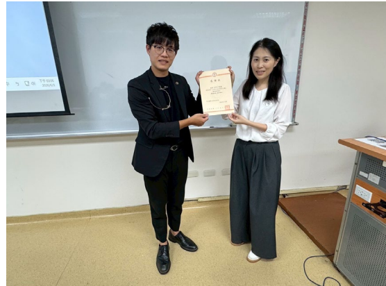
頒發感謝狀給與光明分子