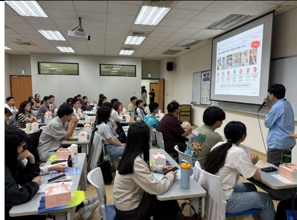
聚英眼科介紹公司與薪資結構